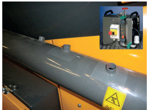
Кислотный аппарат для дозирования с напряжением в 24 вольт и интерфейс на поворотном шнеке.

С этой целью возможно снабжение интерфейсом для подключения внешнего аппарата для дозирования, и электропитания в 24 вольт.