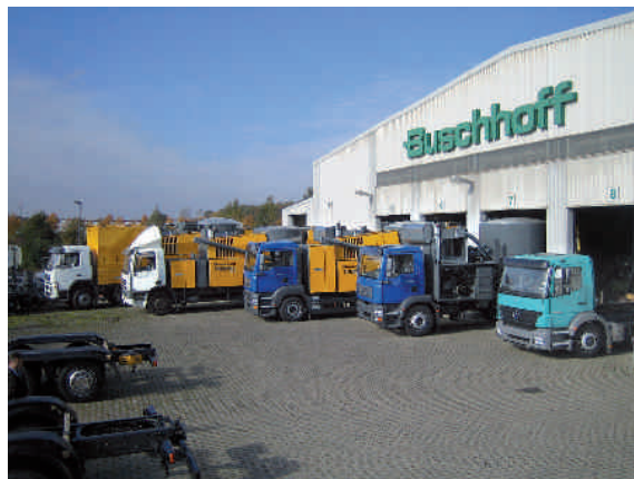
Сборочный цех TOURMIX

Типоряд TOURMIX 02 представляет собой новое поколение мобильных комбикормовых