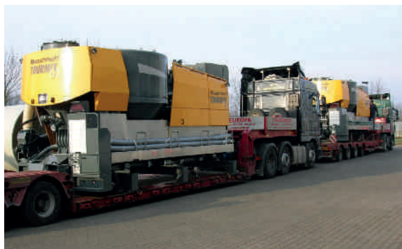
Транспортировка на низкорамном грузовом автомобиле

Для стационарного использования, например в восточноевропейских крупных предприятиях, установки могут поставляться также на транспортно-монтажной раме.