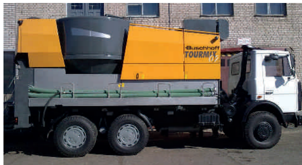
TOURMIX 02 на шасси автомобиля МАЗ

Эти машины делают возможными даже обработку свежего зерна. Модели TOURMIX 02-VE и TOURMIX 02-V-VE могут работать в непрерывном процессе: зерно сначала всасывается, затем измельчается и снова выводится. На поворотном шнеке в шрот подмешивают консервирующие вещества.