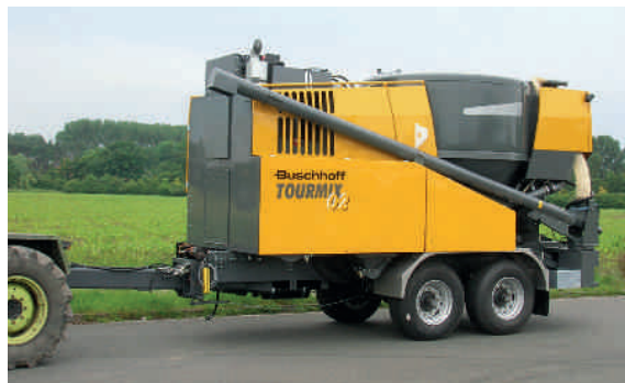
TOURMIX 02 на тандем прицепе