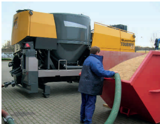
TOURMIX 02 в стационарном исполнении

На установке работает автоматическая аспирация по отделению муки, не требующая особого теххода.