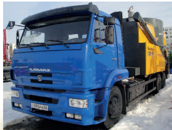
TOURMIX 02 на шасси автомобиля КАМАЗ