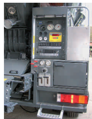
Пульт управления TOURMIX