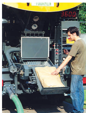
Воронка для загрузки компонентов с устройством для вскрывания мешков