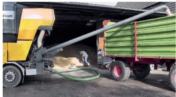
TOURMIX при непрерывном дроблении

При этом отгрузка при помощи поворотного шнека позволяет производить практически беспыльную отгрузку.