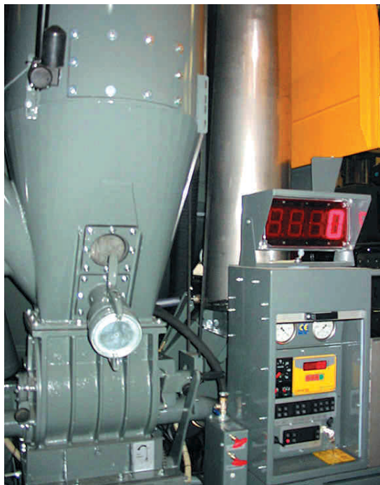
Дозировочная емкость на 150 кг

По желанию заказчика на машине можно установить бак для кормового масла и оборудовать его системой обогрева. Это гарантирует жидкое состояние масла также и в зимний период.